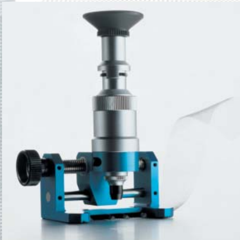
BOPP Mesh Counter