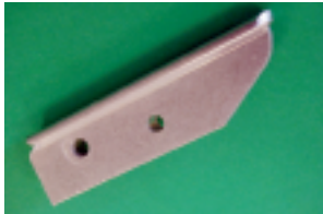
Replacement Blocks for new serilor® CUT (SQ-06)

FIMOR propone una nueva herramienta hecha especialmente para el corte fácil y perfecto de toda tira de hule o plastica de un espesor máximo de 10mm.